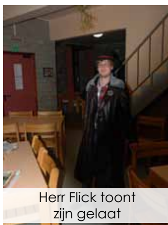
Herr Flick toont zijn gelaat