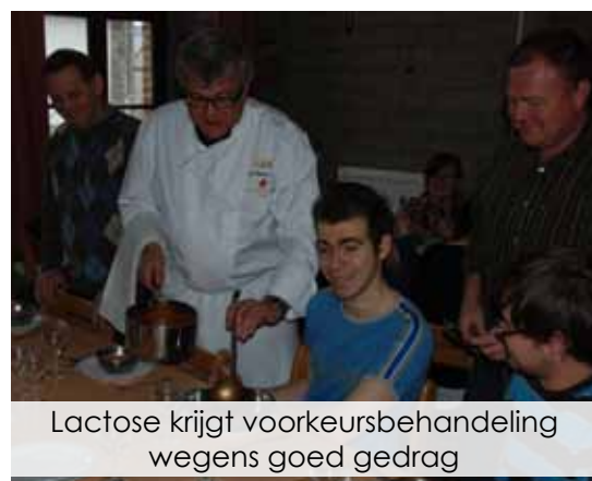
Lactose krijgt voorkeursbehandeling wegens goed gedrag