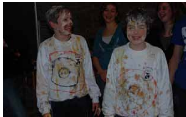
H. Aujourd'hui & E. des Marais Identique net gebruikt als levende schietschijf