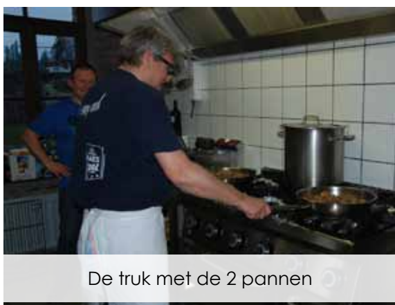
De truk met de 2 pannen