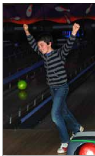
Sommigen smijten al eens een strike